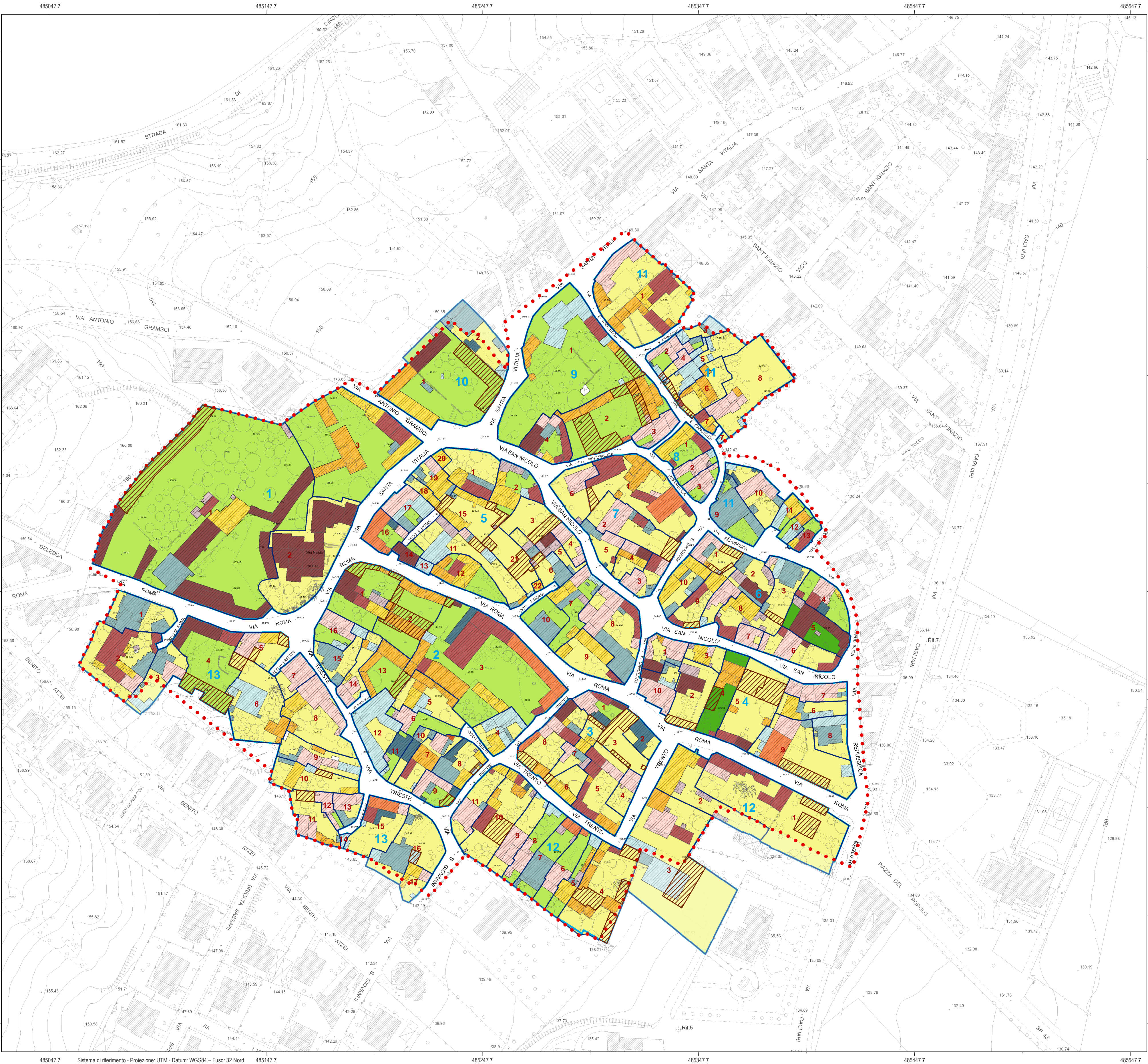
Inquadramento Territoriale - scala 1:20.000

Aree indicative per la localizzazione di eventuali ampliamenti volumetrici